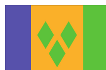
セントビンセント・グレナディーン

アフリカ民族会議(ANC党)の指導者ズマ氏は2009年5月に同国の大統領として宣誓された。政策の方向性の根本的な転換に関する当初の懸念は今のところ根拠がなかったとみられている。実際、ズマ氏は最近の健全な(あるいは保守的な)市場経済が引き続き政策の基盤となることを強調している。経済統計は一般的に良好だが、経常収支赤字に加え、今は財政収支も赤字であることから、それらは注意深い管理が必要とされるだろう。第3四半期の実質GDP統計は、3四半期連続縮小が続いた後、経済回復が進行中であることを示している。今年1.6%の縮小の後、2010年には3%の実質GDPの成長が期待されるだろう。