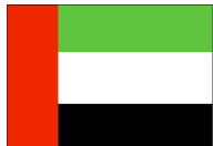
アラブ首長国連邦

ドバイを代表する2つの旗艦(フラグシップ)会社(ドバイ・ワールド社とその不動産子会社ナキール)が、債務リストラの第一歩として、6ヶ月の債務返済猶予を申し出ているという発表は驚きだった。これによって、ドバイの債務不履行に対する保証のコストは急上昇した。ドバイ・ワールド社の債務はUSD220~590億ドルとも推計され、このうち債務リストラの対象とされる金額は、この下限程度の規模と見られる。この債務の位置づけおよび政府保証の(それが現実であれば)その水準に関する不透明性が世界経済にマイナスの波及効果を与えた。債務リストラ契約は形成されるだろうが、湾岸地域に対する投資家の信頼を失ったと言える。